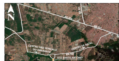
IMAGEM DE SATELITE SEM ESCALA